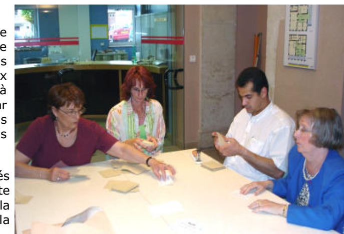
Ouverture des enveloppes et annonce.

Les résultats sont transcrits, affichés en Mairie et envoyés par fax à la Préfecture. Le procès-verbal, la liste d'émargements et les bulletins nuls sont centralisés par la Gendarmerie qui est chargée de les acheminer à la Préfecture.