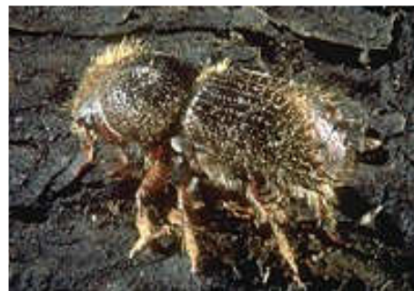
Insecte adulte – grossissement 10 fois (taille réelle : 5mm)

L'adulte mesure environ 5 mm de long. Il est de couleur brun foncé. Il pond dans l'écorce et ne laisse donc aucune trace de galerie dans le bois. Il appartient aux quelques scolytes qui tendent à pulluler si les conditions leur sont favorables et qui risquent ainsi de mettre en danger les peuplements forestiers.