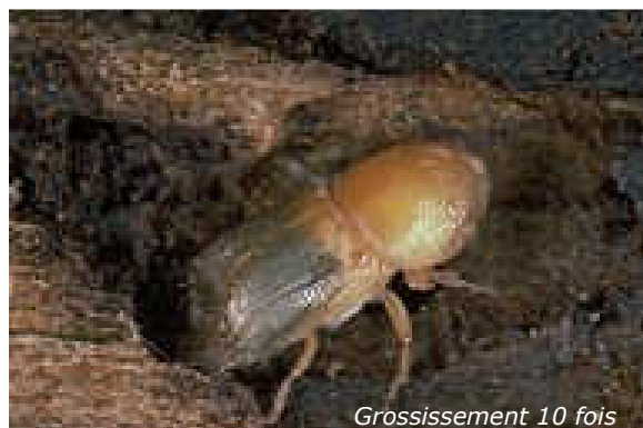
Grossissement 10 fois

Au terme de son développement, la nymphe se transforme en un jeune coléoptère brun clair (adulte immature), aux tissus encore peu résistants. Celui-ci se nourrit du liber afin d'atteindre sa maturité sexuelle. Cette activité, qui dure 2 ou 3 semaines, modifie profondément les structures du système de galerie. Après ce stade, l'insecte est adulte et de couleur brun foncé. Il creuse un dernier trou de sortie d'où il prendra son envol à la recherche d'un nouvel arbre à coloniser.