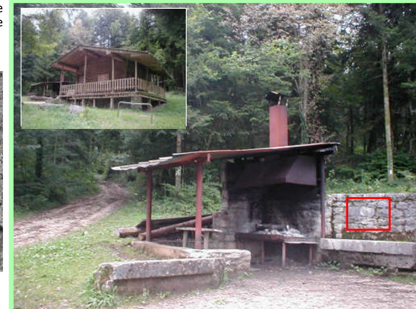
Il s'agissait du barbecue attenant au Chalet des Chasseurs.