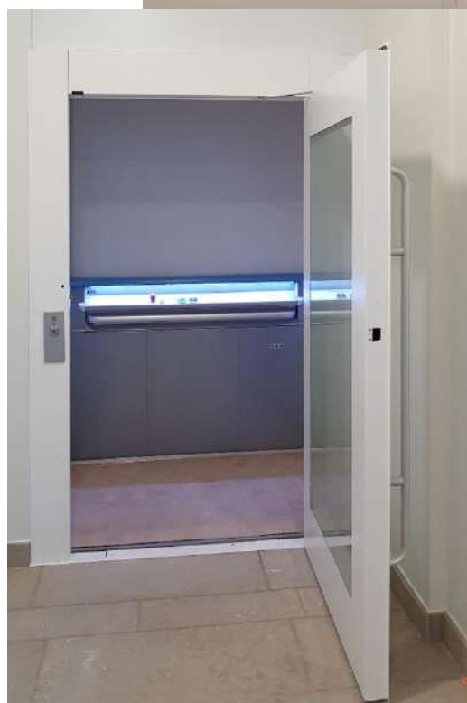
Elévateur pour les personnes à mobilité réduite