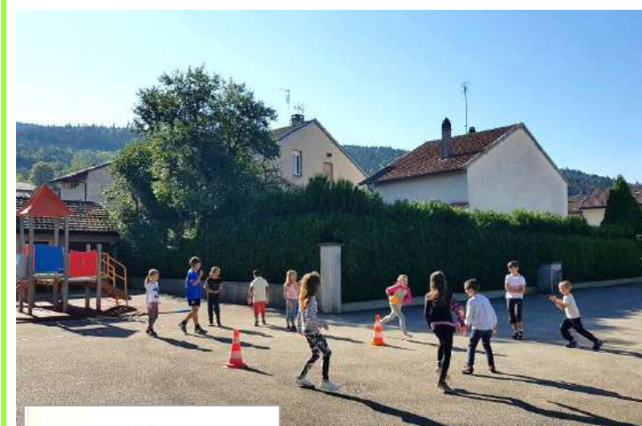
Les enfants le mercredi