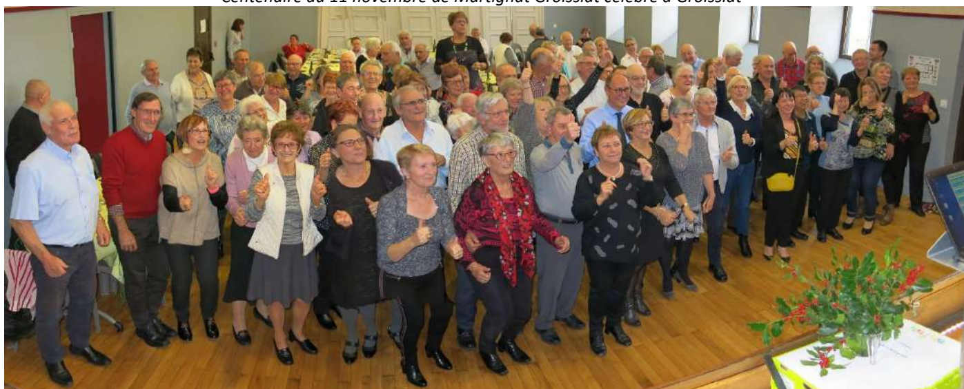
Repas des aînés le 24 novembre avec une magnifique ambiance