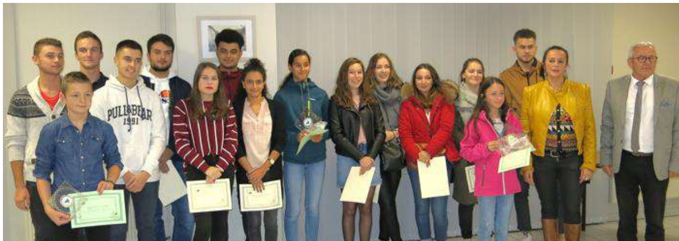
Soirée des récompenses le 26 octobre