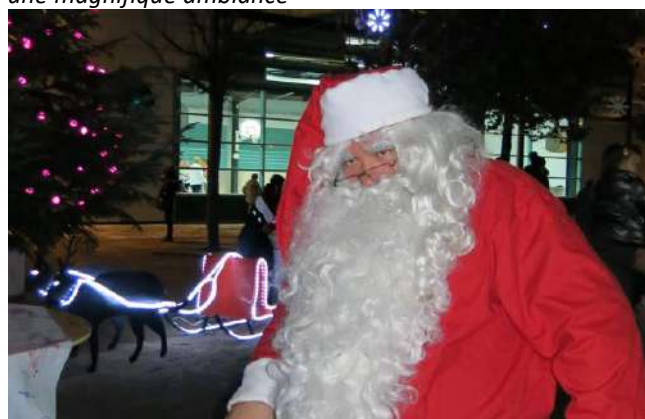
Illuminations le 7 décembre