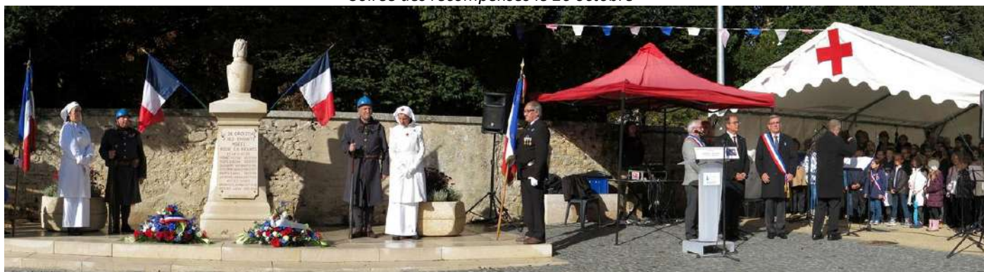
Centenaire du 11 novembre de Martignat Groissiat célébré à Groissiat