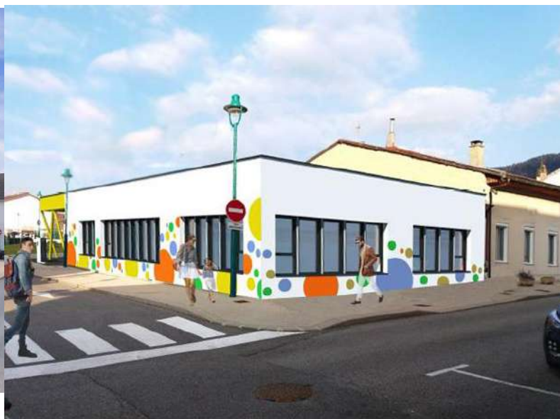
Projet final de la maison d'accueil