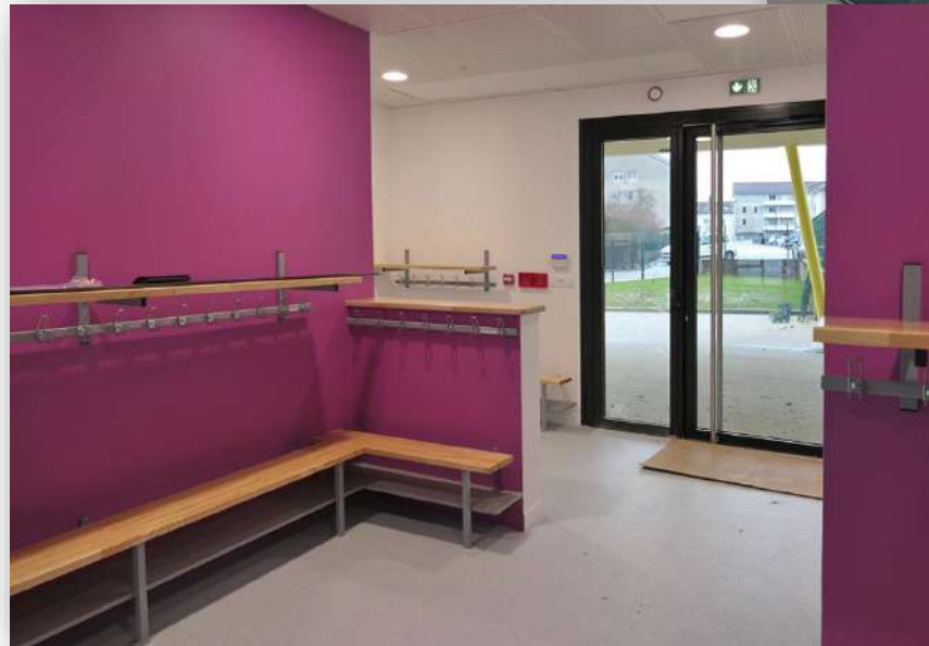
Vestiaires pour toutes les tailles