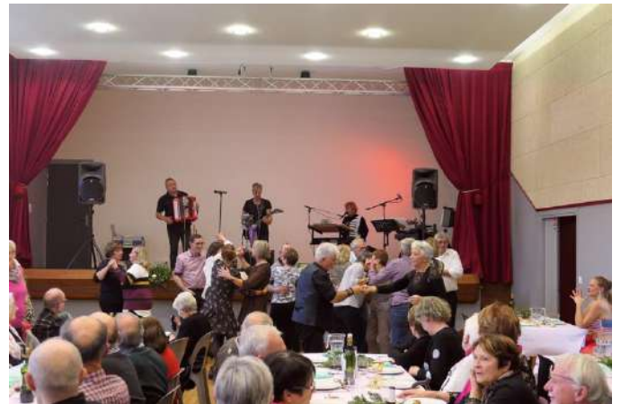
Repas des aînés le 23 novembre dans une chaude ambiance...