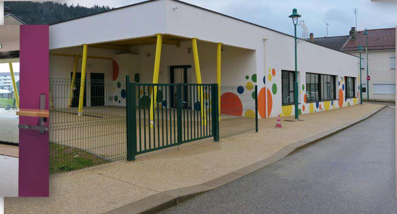
Une superbe maison pour les enfants du village