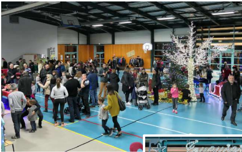
Illuminations le 13 décembre et Noël à l'école