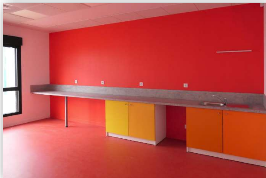
Espace activité cuisine pour nos futurs chefs ....