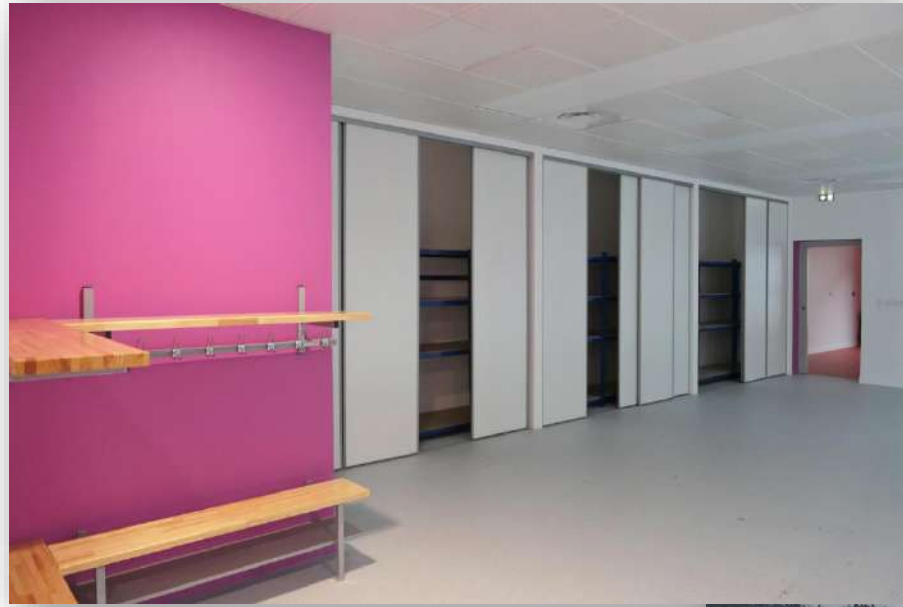
Grands espaces de rangement