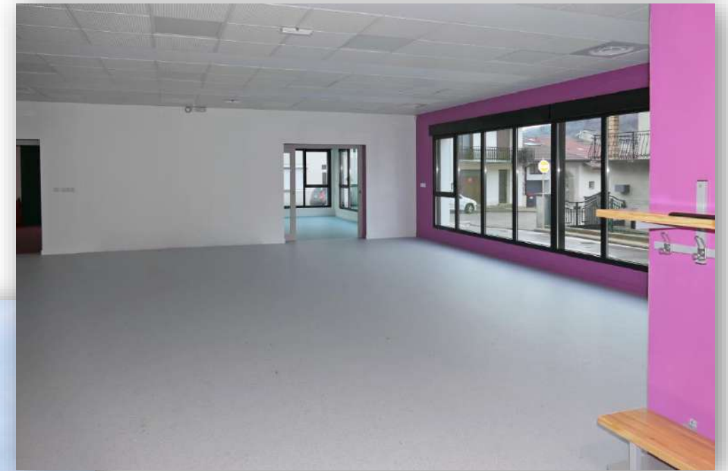
La salle principale multi-activités