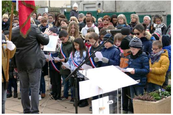
11 novembre à Martignat- Groissiat avec, entres autres, la chorale des enfants de l'école et le conseil municipal des enfants