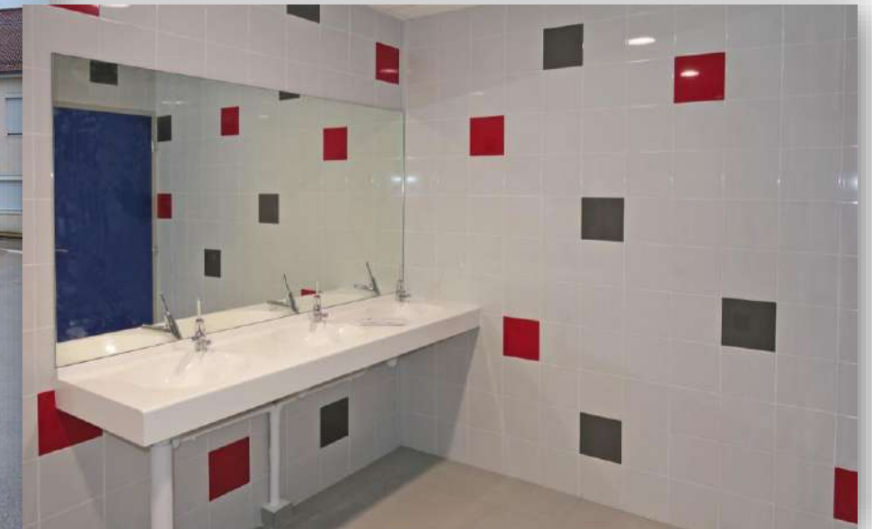
Et après les activités, on se lave les mains ....