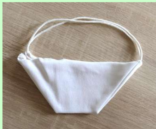
Masque communal distribué gratuitement

Gageons que cette nouvelle façon de vivre que nous allons peut-être devoir envisager, nous fasse apprécier les opportunités qui nous sont offertes localement.