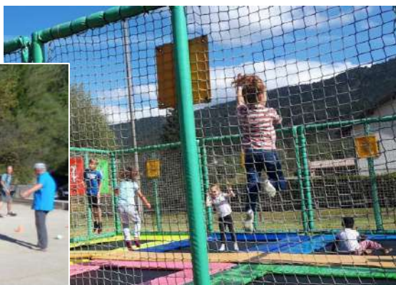
Les animations du plateau sportif : poneys, quads, château gonflable, trampoline, jeux anciens en bois et découverte d'activités sportives