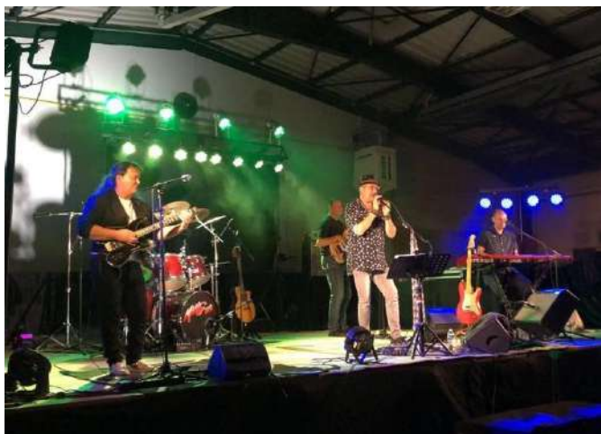
Le concert Pop Rock de Managua le samedi soir