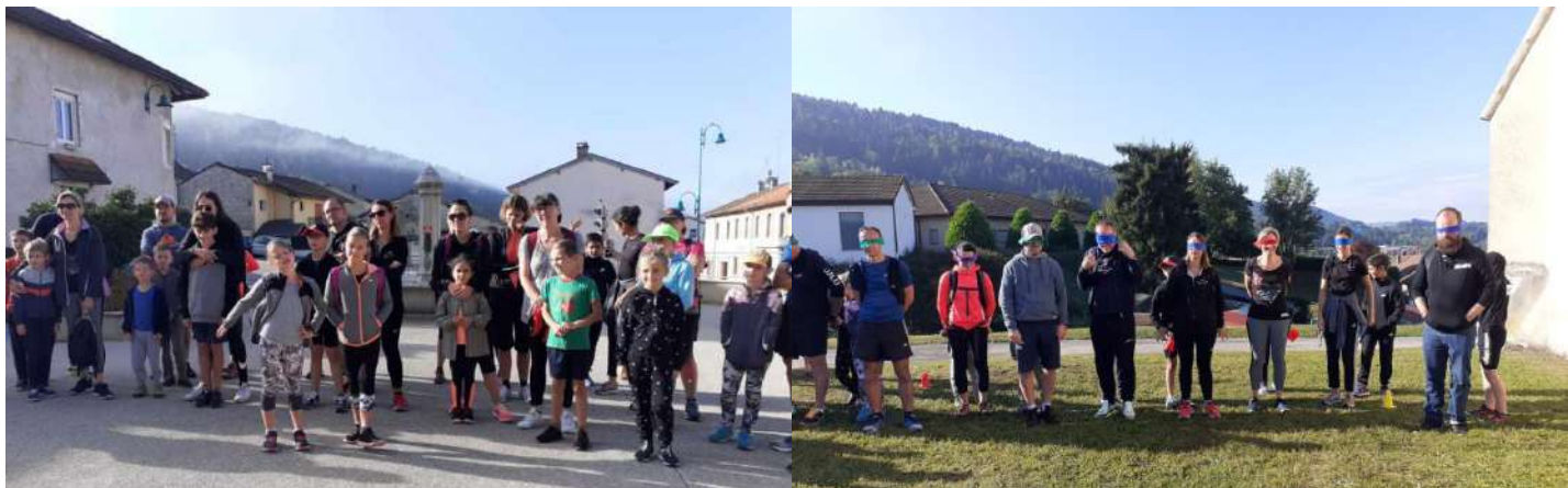
Les équipes du Martignat Express