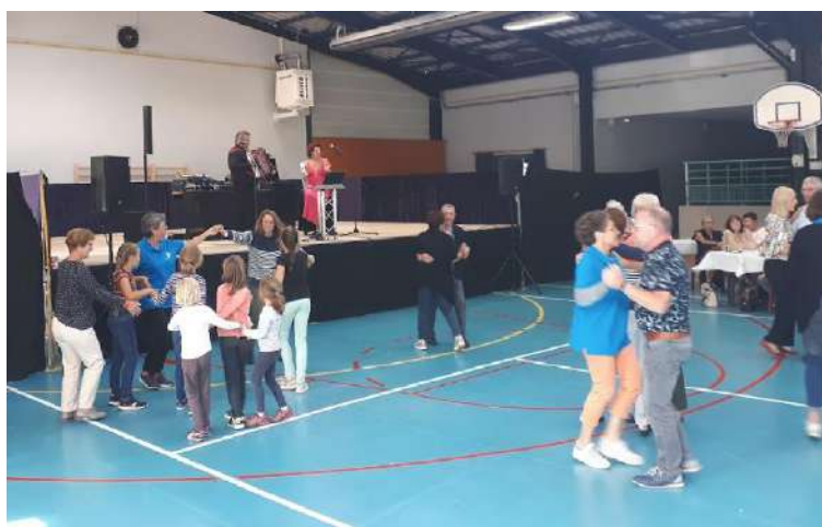
Repas dansant le dimanche.