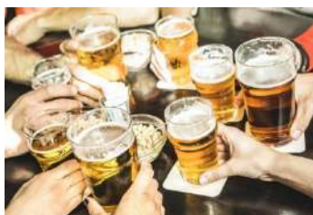
L'abus d'alcool est dangereux pour la santé