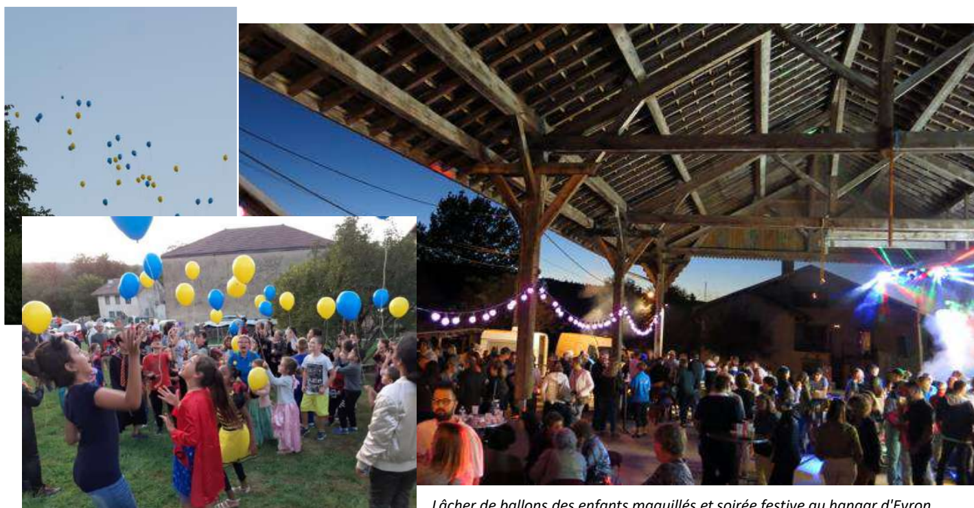
Lâcher de ballons des enfants maquillés et soirée festive au hangar d'Evron