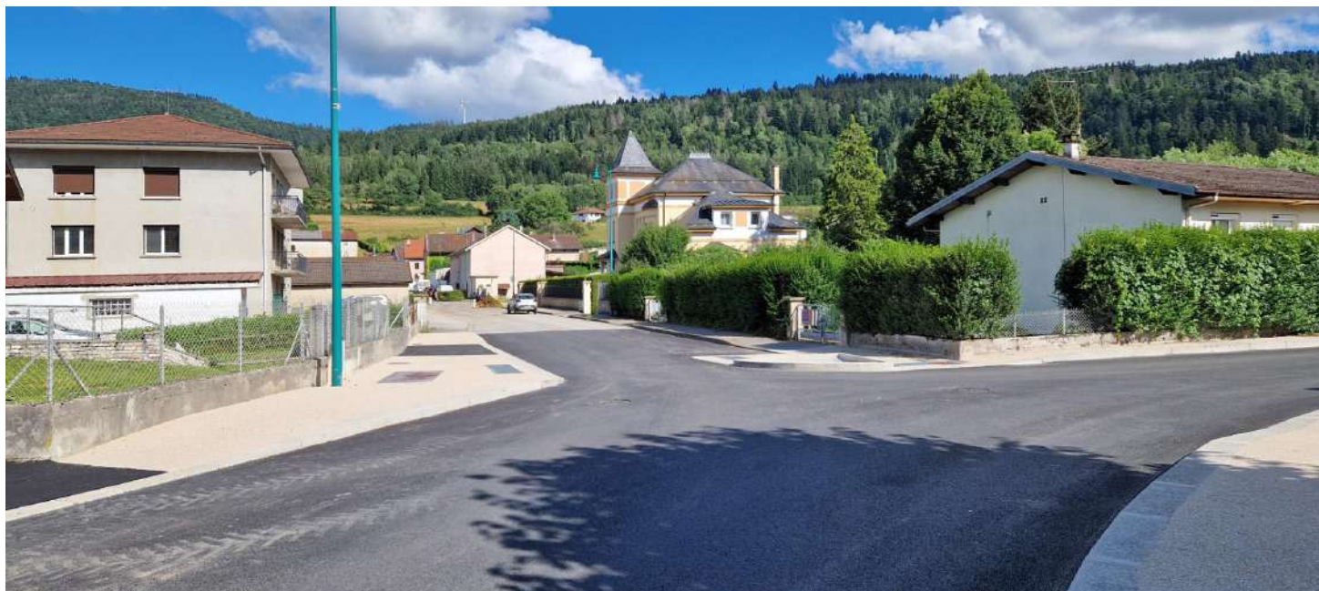
Passage étroit après l'intersection avec la rue de la Bierle