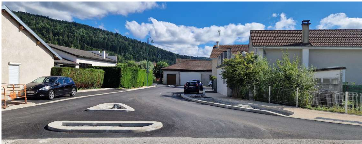
Entrée rue des Peupliers avec terre-pleins centraux

Les travaux de sécurisation rue des Peupliers sont très avancés. La vitesse des véhicules est très favorablement réduite comme le souhaitent les riverains de cette voie.