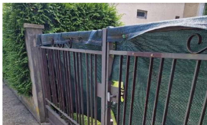
Ce type de bâches de clôtures est désormais interdit