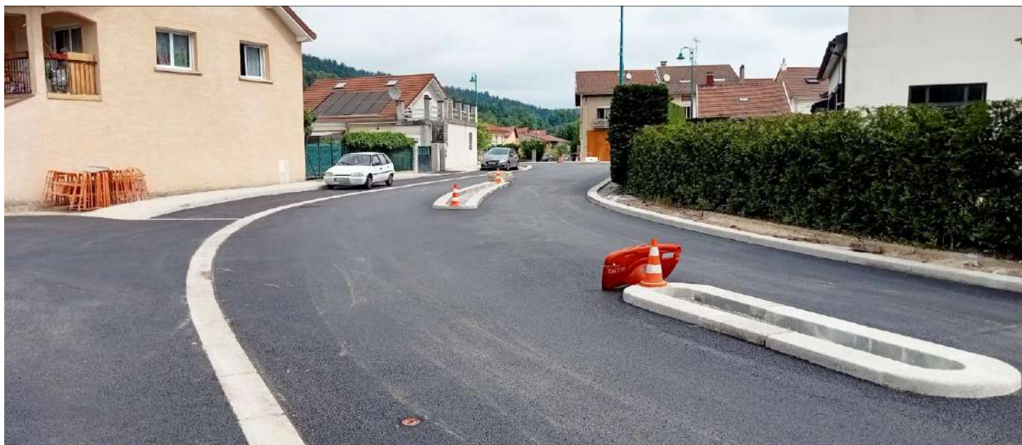
Voies rétrécies et matérialisées