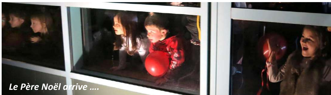
Le Père Noël arrive ....