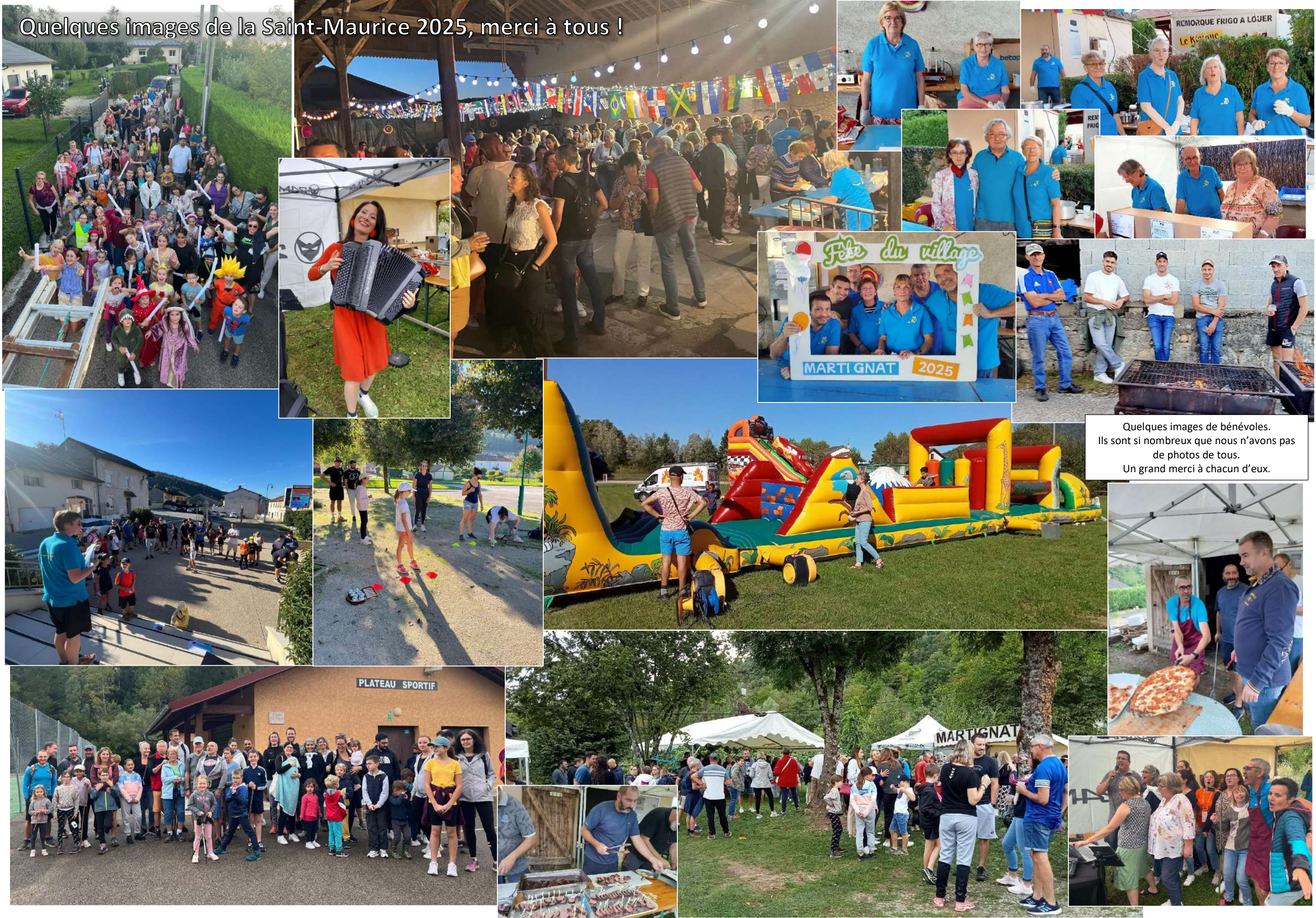
Quelques images de bénévoles. Ils sont si nombreux que nous n'avons pas de photos de tous. Un grand merci à chacun d'eux.