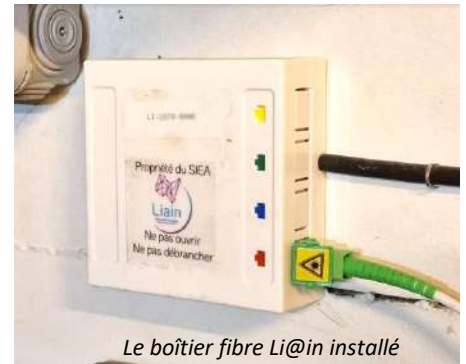
Le boîtier fibre Li@in installé

https://reso-liain.fr/processus-de-pre-raccordement